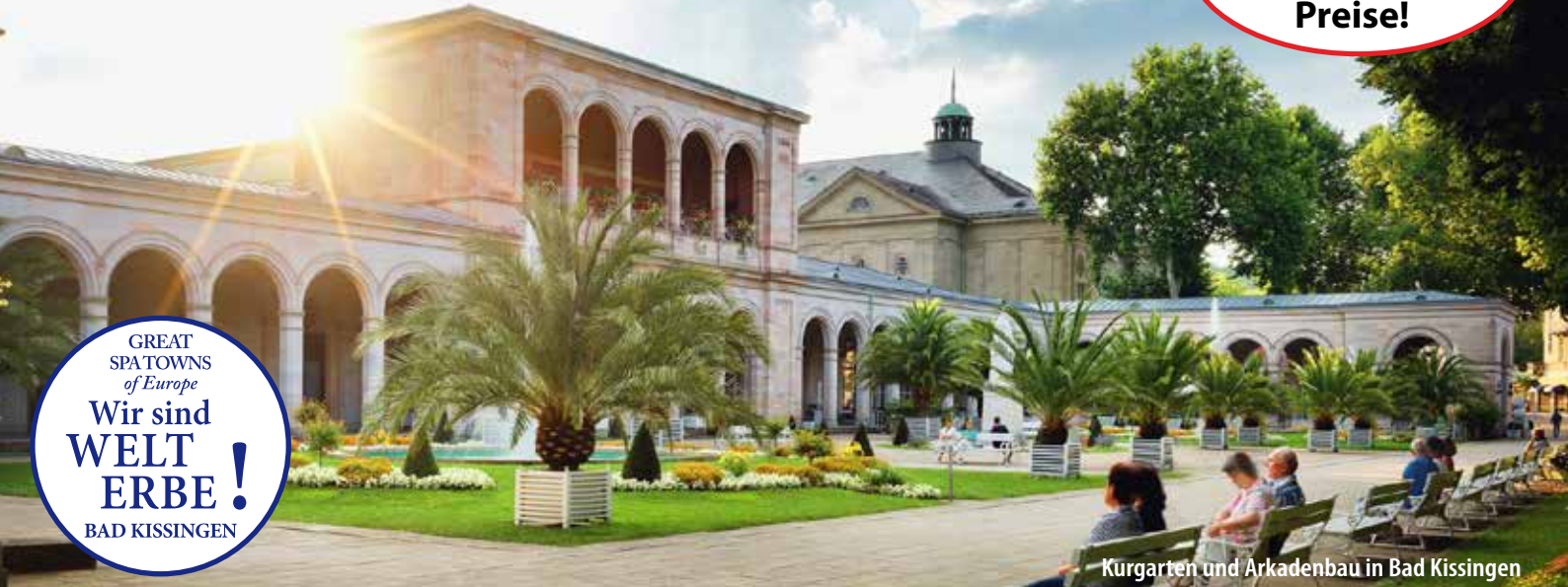
Kurgarten und Arkadenbau in Bad Kissingen

GREAT SPATOWNS of Europe Wir sind WELT ERBE! BAD KISSINGEN