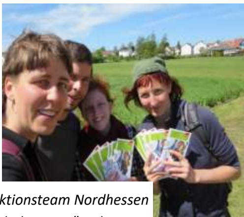
Abbildung 3 Aktionsteam Nordhessen IG BAU Hochschulgruppe "Frohes Schaffen" und ELAI

An 20 Terminen wurden rund 1300 saisonal Beschäftigte angetroffen.