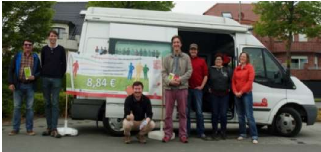
Abbildung 2 Aktionsteam NRW IG BAU/Faire Mobilität

In 2018 wurden die bisher schon stattfindenden Aktionen stärker als in den Vorjahren koordiniert. Es wurde vor Saisonbeginn über den Kreis der Hauptamtlichen in der IG BAU und den Beratungsstellen hinaus für eine Teilnahme an den Aktionen geworben. So sind in Regionen, in denen bisher keine aufsuchende Arbeit stattfand, neue Aktionsteams entstanden. Die meisten Feldaktionen fanden 2018 zu Beginn der Spargelsaison zwischen Ende April bis Mitte Mai statt.