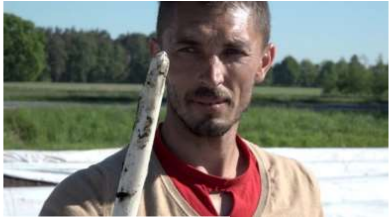
Abbildung 15 Spargelernte

Schutzinstrumente für Arbeitnehmer_innen müssen Teil der Gemeinsamen Agrarpolitik auf europäischer Ebene werden. Direktzahlungen müssen an die Förderung von Guter Arbeit gekoppelt werden. Deshalb soll als erster Schritt der Arbeits- und Gesundheitsschutz in die Cross Compliance aufgenommen werden. Die IG BAU lehnt es ab, dass Unternehmen subventioniert werden, die sich nicht an nationale und europäische Regelungen für Gute Arbeit halten.