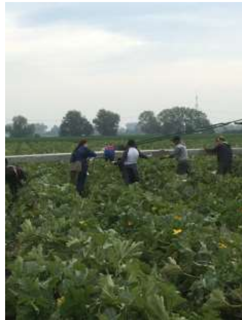
Abbildung 11 Verteilen von Flyern bei der Zucchinierte

Bei den Infoaktionen wurden immer wieder arbeitsrechtliche Verstöße festgestellt. In manchen Fällen wussten die Beschäftigten vorher nicht, dass bestimmte Dinge unzulässig sind oder hatten lediglich „so einen Verdacht“. Ohne die Aufforderung durch die Beschäftigten werden die Beratungsstellen und die anderen an den Aktionen Beteiligten allerdings nicht weitergehend tätig. Häufig scheuen sich Beschäftigte, die Verstöße zu beanstanden, da sie auf den Lohn angewiesen sind und befürchten müssen, im Folgejahr keinen Job beim selben Arbeitgeber oder über die selbe Vermittlung zu bekommen. Dies gilt insbesondere, wenn die Vermittlung wohnortnah oder über private Kontakte im Heimatland geschieht.