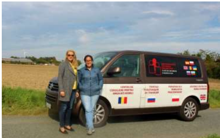
Abbildung 10 Aktionsteam Niedersachsen Beratungsstelle für mobile Beschäftigte

Für die Betriebe lohnt sich dies doppelt: es wird mit der Spargelspinne effizienter geerntet und sie bezahlen nur 75% des Lohnes. Ein weiteres Beispiel ist, dass Beschäftigte Gummibänder für das Bündeln von Radieschen und Frühlingszwiebeln beim Arbeitgeber kaufen müssen.