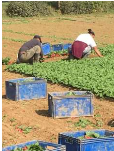
Abbildung 12 Ernte von Radieschen

Individuell können Beschäftigte ihre Ansprüche schriftlich und dann juristisch geltend machen . Hierfür bekommen sie Unterstützung von den Beratungsstellen, bei Mitgliedschaft auch von der IG BAU. Diese Möglichkeit bietet sich bei Arbeitgebern an, die auf persönliche und telefonische Aufforderung uneinsichtig reagieren. Zwei polnische Erntehelfer, die auf einem Weingut in Hessen gearbeitet haben und nicht bezahlt wurden, konnten im letzten Jahr so vor Gericht ihren Jahreslohn erstreiten.