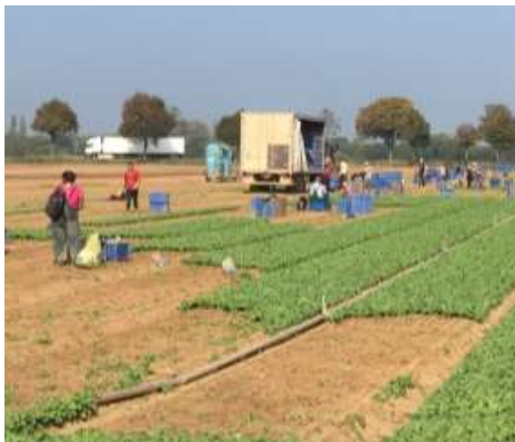
Abbildung 9 Feldaktion: Ernehelfer_innen bei der Radieschenernte

Immer wieder werden Unterkünfte unter den Standards der Arbeitsstättenverordnung angeboten. Häufig sind die Unterkünfte zu klein, ohne ausreichend Sozialräume oder Kochmöglichkeit. Auf einem Betrieb berichteten Beschäftigte, es wäre nicht genügend Wasser vorhanden, damit alle abends warm duschen könnten. Auch der hygienische Zustand der Sanitäranlagen wurde auf mehreren Betrieben bemängelt. Die zugesicherte Verpflegung entsprach in Menge und Qualität nicht überall dem, was bei