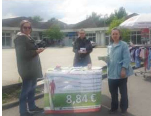
Abbildung 6 Aktionsteam Berlin/Brandenburg Fachstelle Migration und Gute Arbeit-Arbeit und Leben/BEB/IG BAU

Im Vergleich zum Vorjahr wurde ein verändertes Verhalten der Betriebsleitungen und der Beschäftigten in bereits aufgesuchten Regionen festgestellt. In einigen Betrieben, in denen im letzten Jahr noch der Zugang zu den Saisonkräften durch Vorarbeiter_innen oder Betriebsleitung erschwert wurde, wurde in diesem Jahr (fast) immer von Seiten der Betriebsleitung die Möglichkeit gegeben mit den Menschen auf den Feldern zu