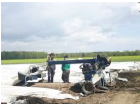
Abbildung 8 Feldaktion: Gespräch an einer Spargelspinne

Für die Durchsetzung der Zahlung der ausstehenden Löhne, sind schriftliche Arbeitszeitaufzeichnungen als Nachweis von großer Bedeutung. Eigene Aufzeichnungen, am besten von Arbeitskolleg_innen oder Vorgesetzten bezeugt, führen