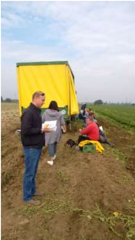
Abbildung 14 Pause auf dem Feld - Verteilen von Flyern und Gespräche

Die Informationsaktionen in der Landwirtschaft sollen auch im kommenden Jahr 2019 fortgeführt werden. Hierbei sollen die Erfahrungen aus den verschiedenen Regionen möglichst unter allen Teilnehmer_innen verbreitet werden. Dies soll durch ein Vernetzungstreffen im Frühjahr 2019 erreicht werden. Dass der Bedarf daran besteht, war eine wichtige Rückmeldung der regionalen Aktionsteams und Beratungsstellen. Es besteht ein großer Bedarf daran, sich unter den Aktiven auszutauschen, um konkrete Handlungsketten bei Rückmeldungen von Ratsuchenden zu bestimmen. Insbesondere ist nicht immer klar, welche Einrichtungen oder Personen bei unterschiedlichen Themen Unterstützung leisten können.