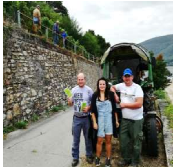
Abbildung 5 Aktion im Weinbau Hessen EVW