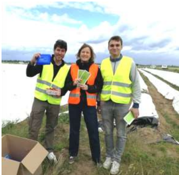
Abbildung 4 Aktionsteam Hessen IG BAU/EVW/Faire Mobilität

Diese breite Beteiligung unterschiedlicher Gruppen geht auch darauf zurück, dass einerseits innerhalb der IG BAU für die Teilnahme geworben wurde. Außerdem wurde der Aufruf zur Beteiligung auf verschiedenen Plattformen veröffentlicht. Kooperationen mit den arbeitsrechtlichen Beratungsstellen wurden fortgeführt und ausgebaut.