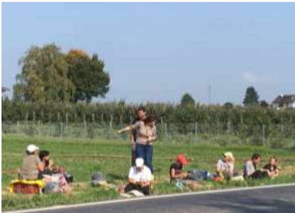
Abbildung 13 Feldaktion - Pause am Feldrand Gespräch mit Berater_innen

Außerdem sind Aussagen von Beschäftigten wichtig, damit der Zoll die Mindestlohnverstöße nachweisen kann. Für die Mindestlohnverstöße wird durch den Zoll allerdings nur der Betrieb gegenüber den Finanzamt und den Sozialversicherungsträgern belangt. Ausstehende Löhne kommen über diesen Weg